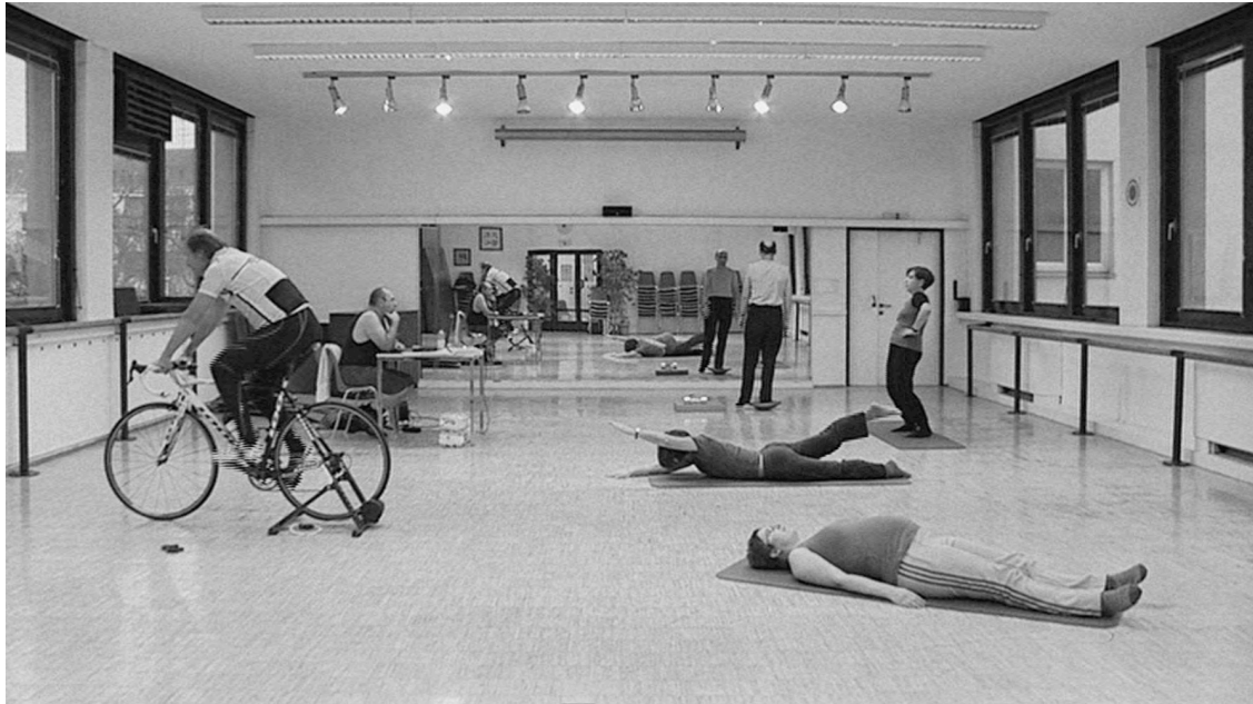
3. Josef Dabernig, excursus on fitness , 2010, courtesy Andreas Huber en Wilfried Lentz