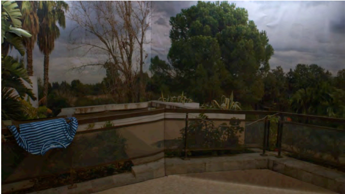
1. Neïl Beloufa, Untitled , 2010, courtesy de kunstenaar

(beeldmateriaal verkrijgbaar op aanvraag)