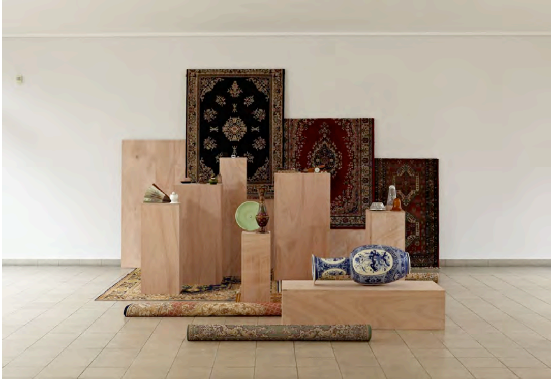
5. Isabelle Cornaro, Landscape with Poussin and eye witnesses (III) , 2009