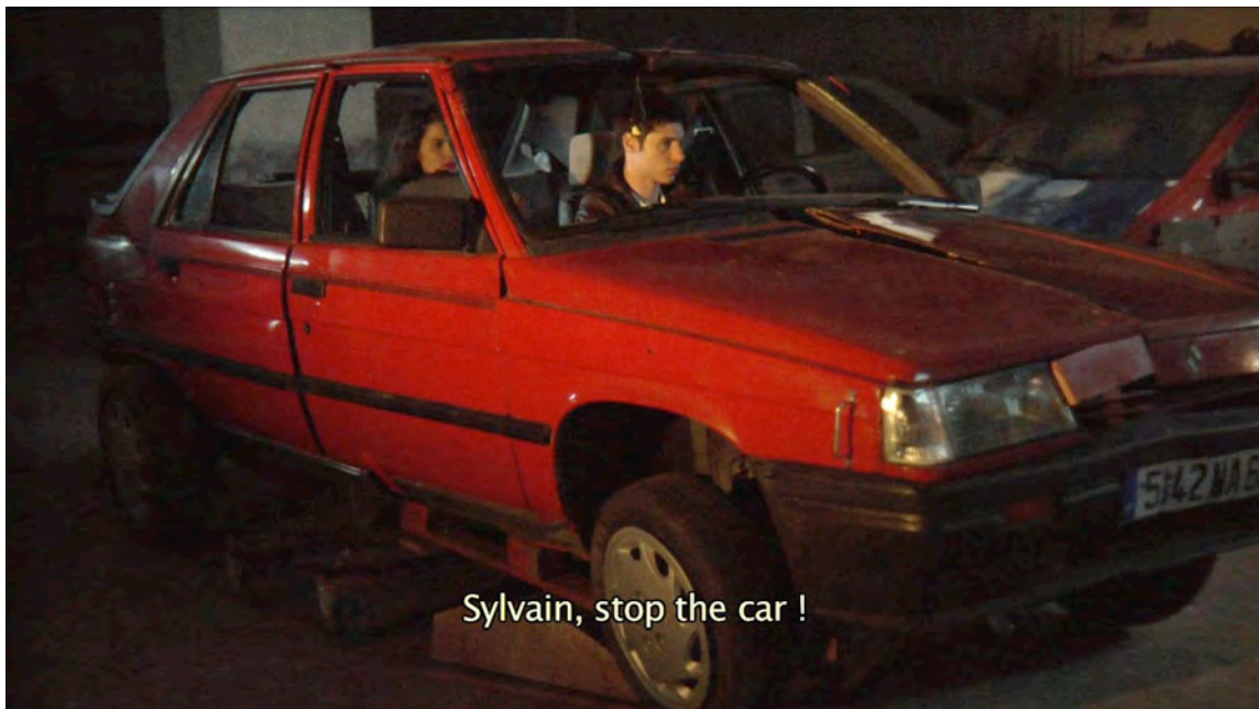
2. Neïl Beloufa, Brune Renault , 2009, courtesy de kunstenaar